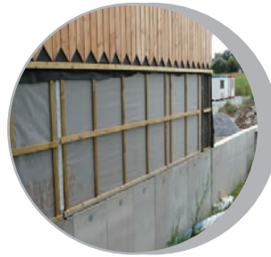
Place au bardage bois