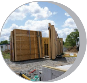
Réception, puis montage des cloisons en ossature bois