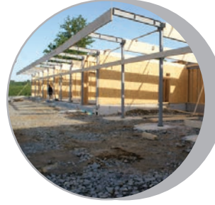
Eléments de charpente