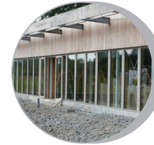
Vue générale sur le bâtiment