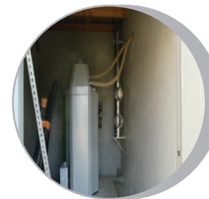
La chaufferie et la réserve à granulés